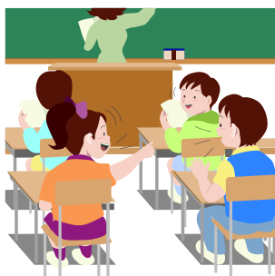
ГРАФИК ЗАНЯТОСТИ КАБИНЕТА № 407 В 1 СМЕНУ